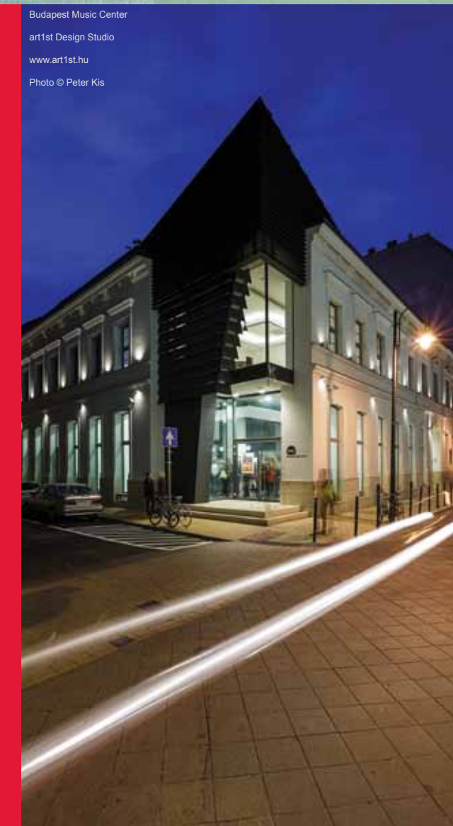
Budapest Music Center art1st Design Studio www.art1st.hu