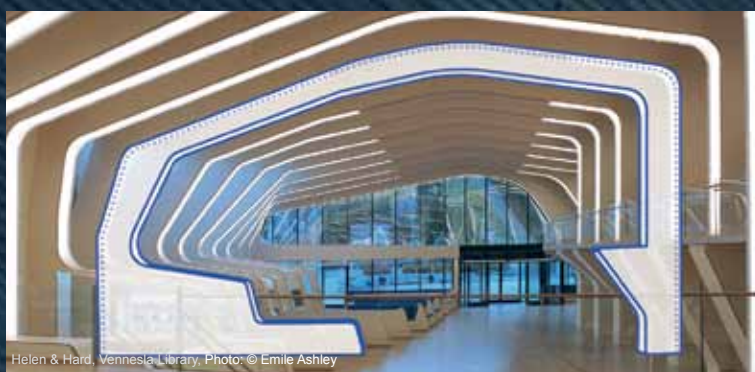
Helen & Hard, Vennesla Library.

Присутствующие в ArchiCAD инструменты Оболочка и МОРФ предоставляют возможности интуитивно понятного графического моделирования элементов любых геометрических форм.